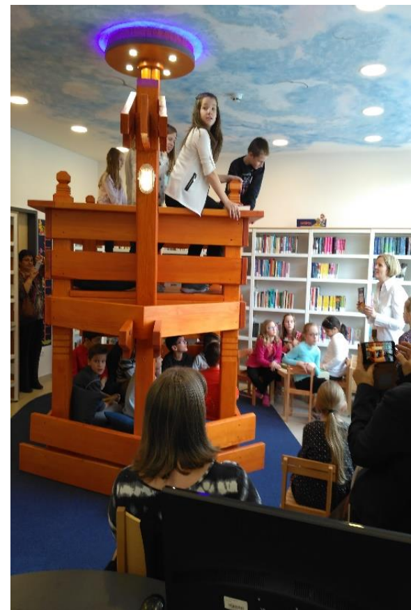
XVIII. Pestszentimrei Könyvtár