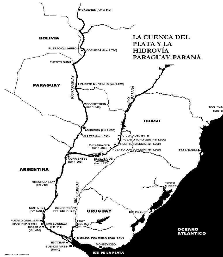
1. ábra: a La Plata medence és a Paraná- Paraguay-alföld vízhálózata