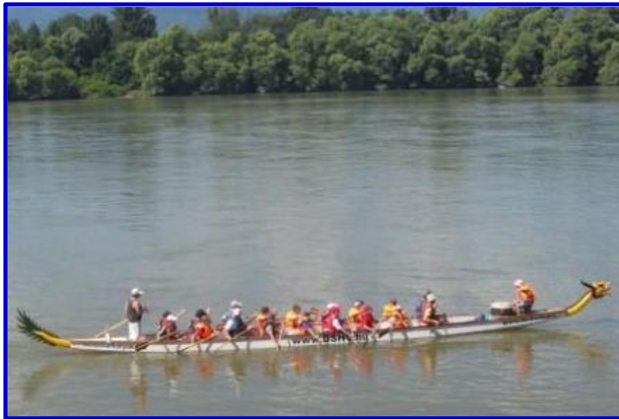
9. sz. fotó: Sárkányhajó 10

A sportág Dél-Kínából származik. A 13 méter körüli kenu típusú 250 kg súlyú hajó, amelynek az elején sárkányfej, a hátulján sárkányfarok van. A kormányos irányítja, az evezés a dobos által adott az ütemre történik. A 18 evező összehangolása komoly teljesítmény, és rendkívül jó csapatépítő lehetőség. Hazánkban egyre elterjedtebb.