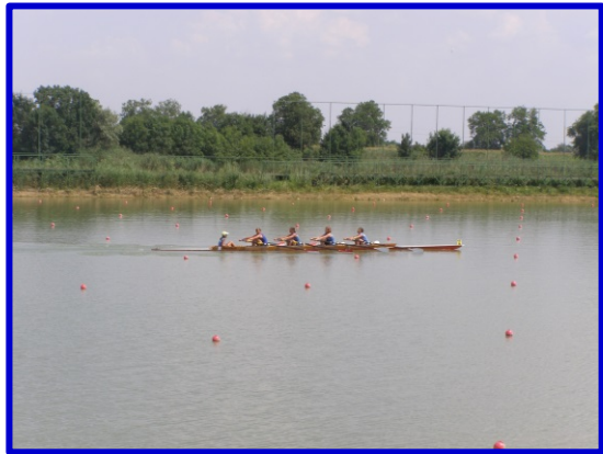
4-5. sz. fotók: Edzéseken és háziversenyeken erősítik és nevelik az utánpótlást 3