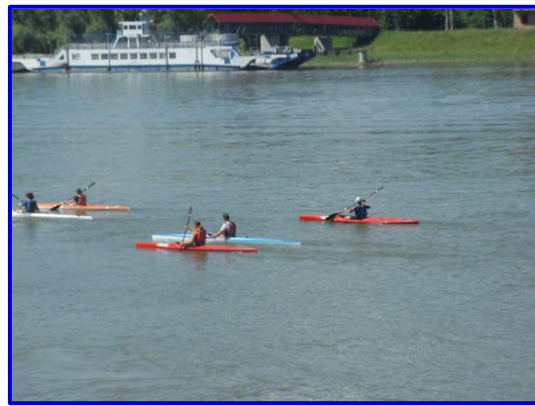
7-8. sz. fotók. Kenu és a kajak 5

Van olyan hajó, amit egy ember lapáttal (kajak egyes K1, kenu egyes C1), vannak olyan hajók, amiben ketten ülnek (kajak kettős, vagy kajak páros K2, és a kenu kettős C2), továbbá vannak négyszemélyes hajók, mint a kajak négyes K4 és a kenu négyes (C4)